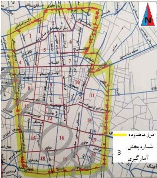
شکل ۲. بخش بندی محدوده مورد مطالعه برای داده برداری